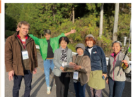
＊(裏3ページ〜裏7ページ)「参加者から、参加体験を聞き取りました」

暮らし続けるための 未来予想図を描く！ ——かけがえのない暮らしを、笑顔を守りたい！——