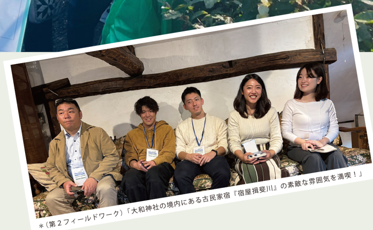
※(第2フィールドワーク)「大和神社の境内にある古民家宿『宿屋揖斐川』の素敵な雰囲気を楽しもう!」